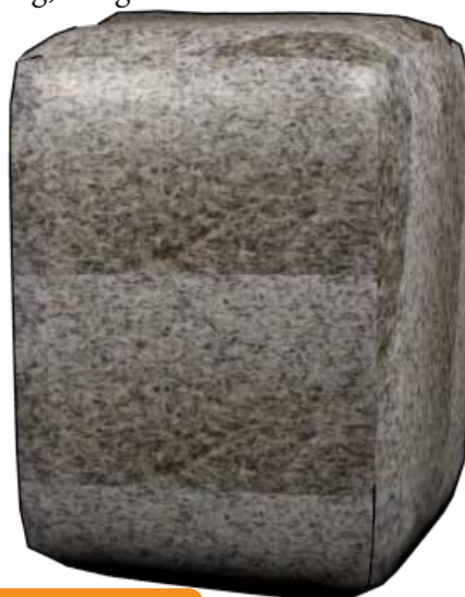
Ref : PORTE-TT