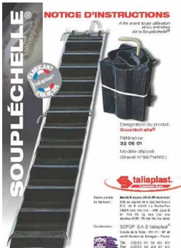
Ref : PORTE-TT