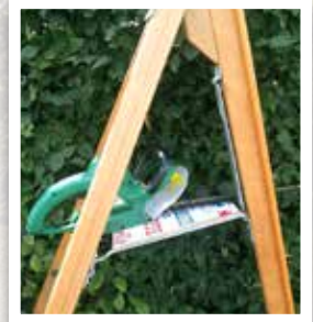
TABLETTE SUPPORT ET MÉCANISME DE VERROUILLAGE

MONTANTS EN WESTERN HEMLOCK OU ÉPICÉA 1ER CHOIX, SANS NOEUD