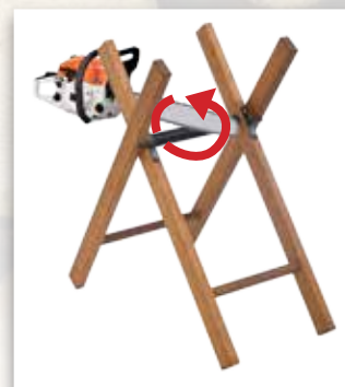
TUBE ROTATIF EN PVC Évite le désaffutage des lames ou des chaînes