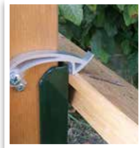
CLIP DE VERROUILLAGE

Traitement imprégnation hydrofuge et fongicide