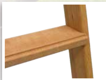
MARCHES LARGES ET PLATES STRIÉES