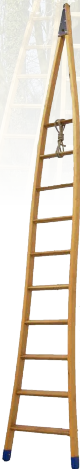
Version Hemlock + Robinier français