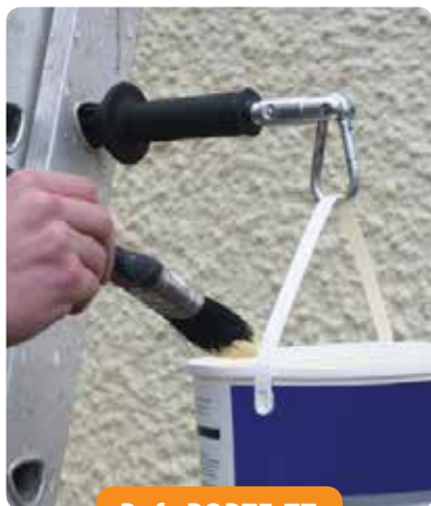
Ref : PORTE-TT