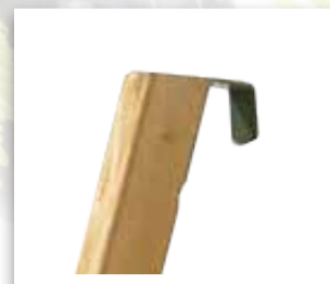
CROCHETS EN TÊTE